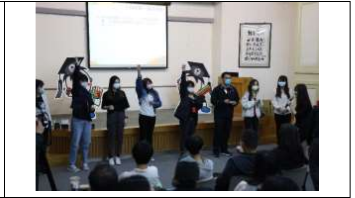
2.旺眾一心(全員大拼圖)：