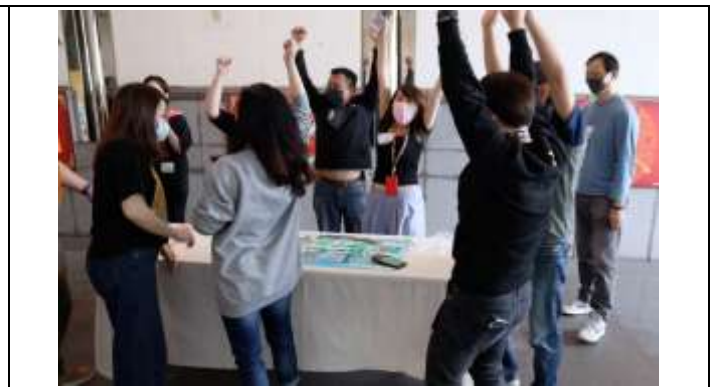
3.旺眾一心(呼拉圈傳遞大賽)：